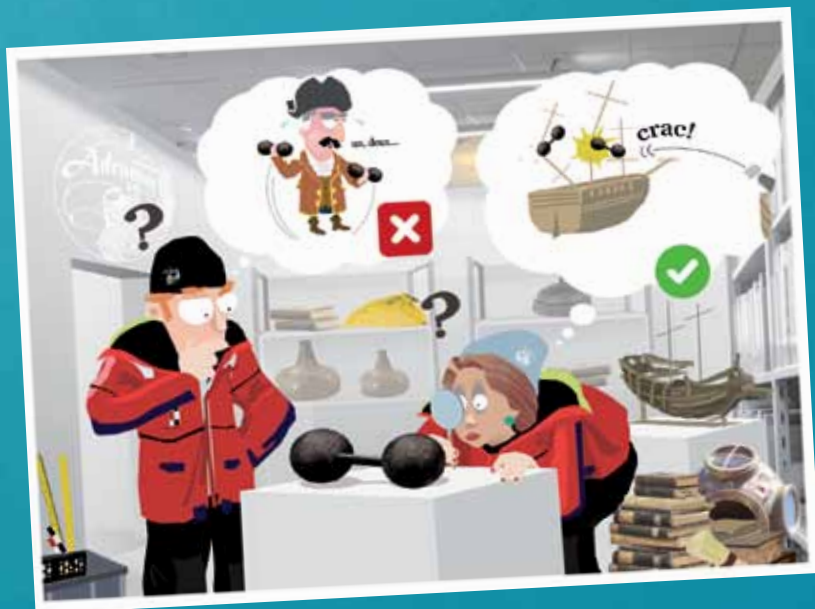
Illustration de François-Xavier Lagey