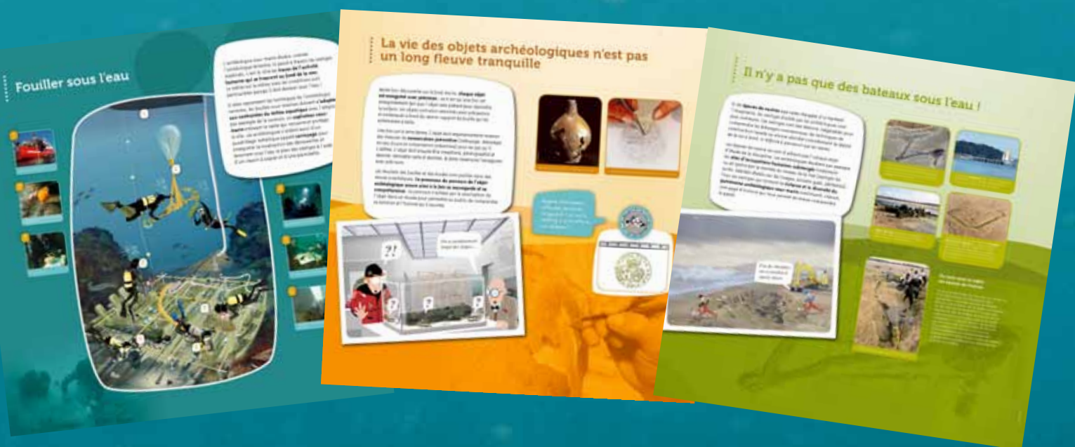
Visuel des panneaux de l'exposition