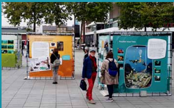
Module cube de l'exposition